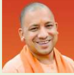
परमपूज्य गोरक्षपीठाधीश्वर योगी आदित्यनाथ जी महाराज