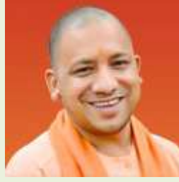
परमपूज्य गोरक्षपीठाधीश्वर योगी आदित्यनाथ जी महाराज