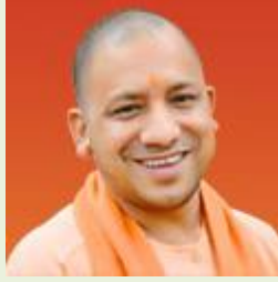
परमपूज्य गोरक्षापीठाधीश्वर योगी आदित्यनाथ जी महाराज मुख्य संरक्षक